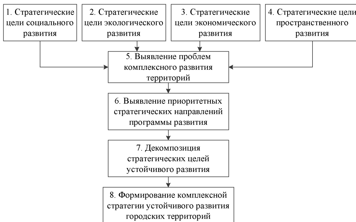
Рисунок 1 – Последовательность формирования стратегических целей устойчивого развития урбанизированных территорий

Все приведенные соображения легли в основу разработанной принципиального алгоритма формирования стратегических целей устойчивого развития урбанизированных территорий (рис. 1).